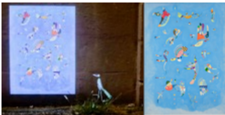
Bleu du ciel de Kandinsky