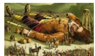
A. Rackam « Le voyage de Gulliver »