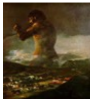
Goya « le colosse »