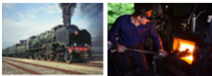
Locomotive à vapeur et un conducteur