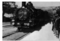
Arrivée en gare de la Ciotat

film majeur de l'histoire du cinématographe , tourné par l'industriel lyonnais Louis Lumière durant l'été 1895